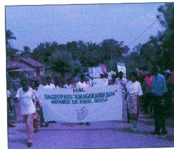
S'informer et se former mutuellement au niveau local.