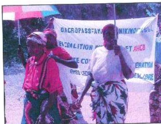
Une forte solidarité pour la réconciliation.