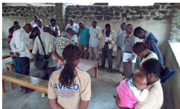
Focus group sur la M P : Roue d'égalité