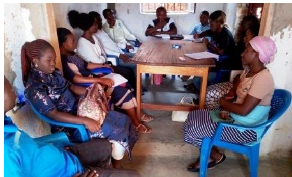
Focus group avec les jeunes : Transformation des conflits