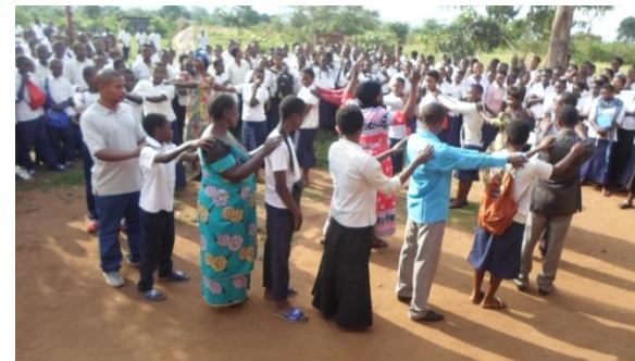
Sensibilisation des élèves : la Non violence